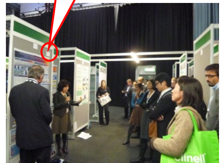
写真1 黒山の人の前で発表