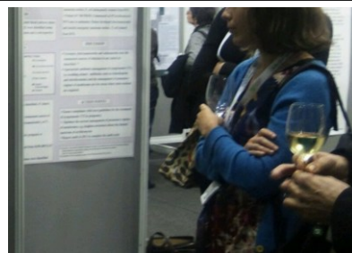
写真3 二日目のポスター会場

国際学会で発表することができたことは、今後の感染管理活動をするうえで励みになりました。